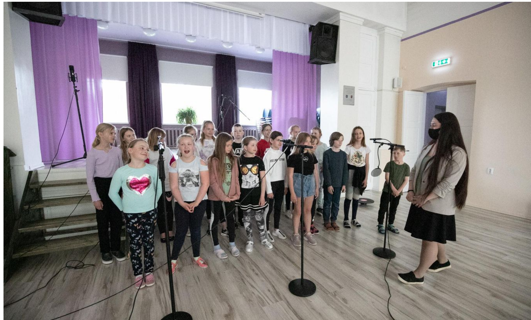
Rakvere põhikooli mudilaskoor salvestab Cydefecti loo jaoks koorilaulu.