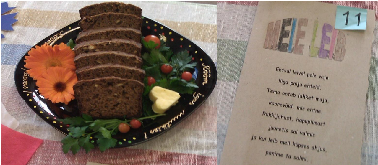
6. klassi esikohavääriliselt serveeritud võiduleib ja esitus.