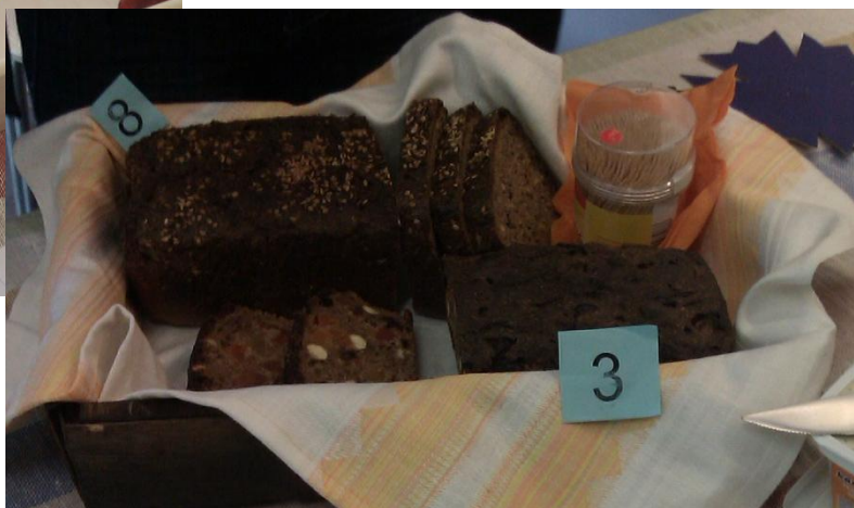
8. klassi leivad, millest puuviljaleivaleiva maitse võitis kõigi südamed.

Tänud kõigi küpsetajatele ja sponsorile AS HALLIK!