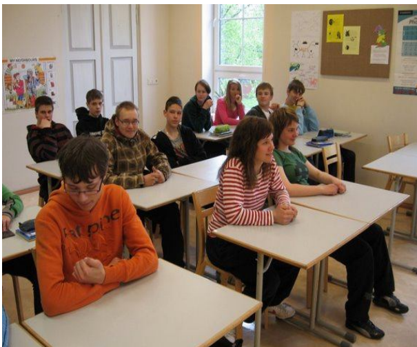
Külalised inglise keele tunnis