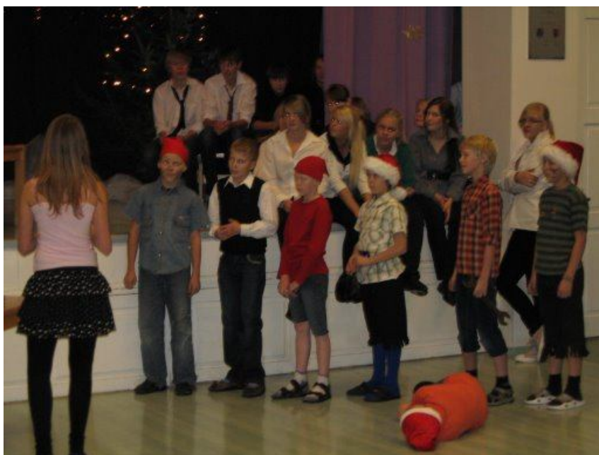
5. klassi lavastus „Lumivalgeke”